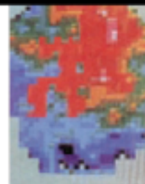
PHOTO 1 : la personne souffre d'une arthrose du genou droit depuis plus de 5 ans, tous les traitements à base d'anti-inflammatoires non stéroïdiens ou infiltrations intra-articulaires de cortisone ont échoués. La douleur est tellement intense que le patient reste parfois plusieurs jours sans pouvoir bouger son genou. Pour le test, le praticien commence l'application du Baume du Siam au Ginseng en massage léger.